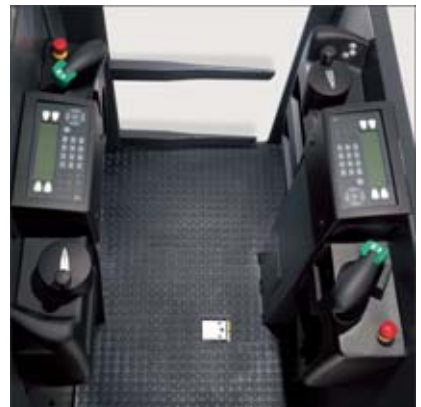
Elementos de mando, lado de carga y lado de accionamiento