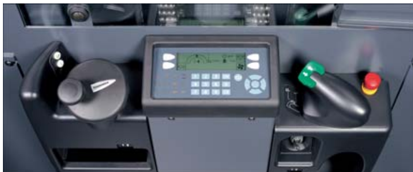
Elementos de mando