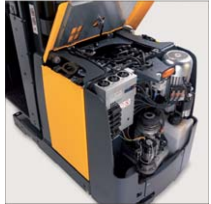
Cámara de accionamiento