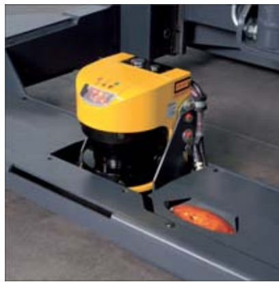
Sistema de protección de personas de Jungheinrich