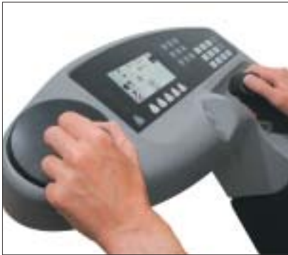
Consola de mandos