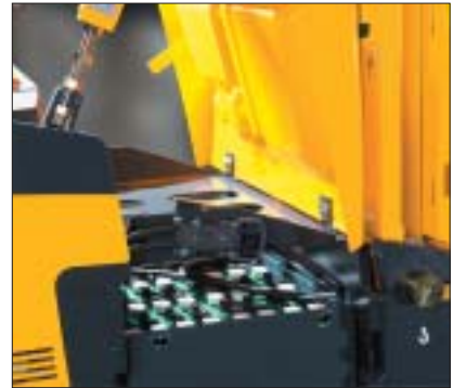
Tapa de batería abatible