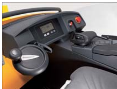
Grupos fácilmente accesibles gracias a cubiertas abatibles