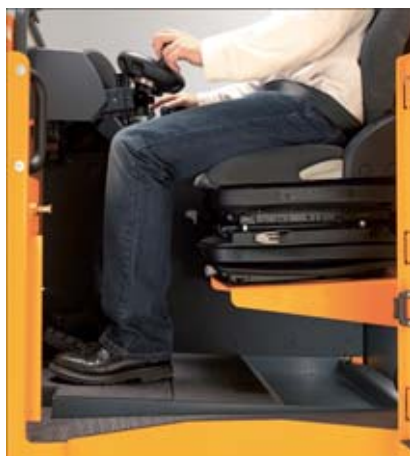
Ubicación óptima de los elementos de manipulación