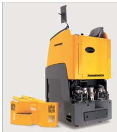
Grupos fácilmente accesibles gracias a cubiertas abatibles