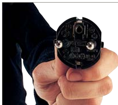
Cargador integrado de 30 A para la carga fácil de la batería en cualquier toma de corriente.

con capacidades de batería de hasta 200 Ah (2 EPzB 130/150/200 Ah), es la mejor garantía para una gran autonomía de la máquina y períodos operativos prolongados: