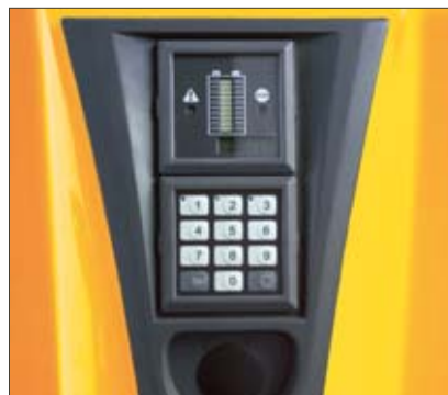
Autorización de acceso CanCode y CanDis (opcional).