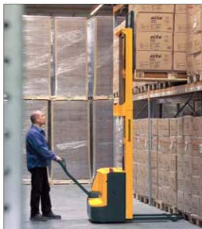
El rendimiento de la EJC en los pasillos de estanterías más estrechos es excelente.