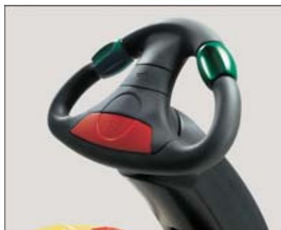
JetPilot – exclusivo de Jungheinrich