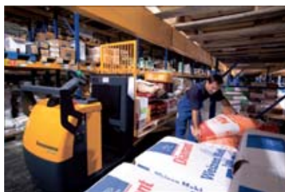
Marcha comfortable y preparación de pedidos rápida

El mando por impulsos «SpeedControl» de Jungheinrich permite una traslación segura y cómoda que se adapta a cualquier aplicación: